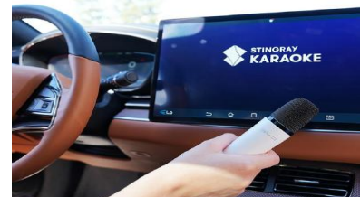
第2回セミナー風景