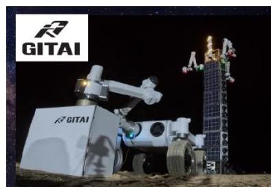
第4回セミナー風景