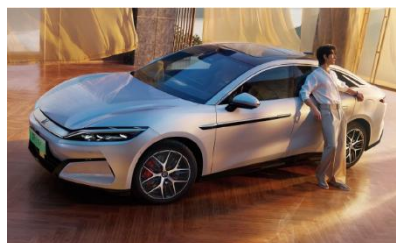
第5回セミナー風景