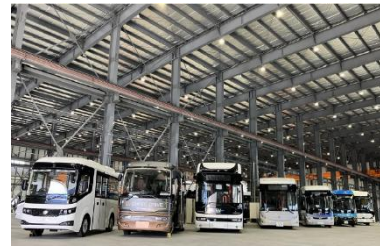
第1回セミナー風景