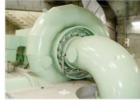
渦巻フランシス水車