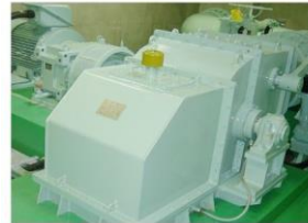
クロスフロー水車