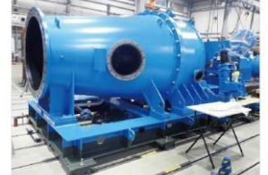
円筒型(横軸・立軸)フランシス水車