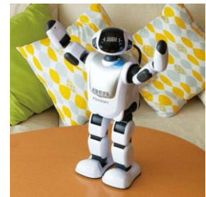
見守り・コミュニケーション