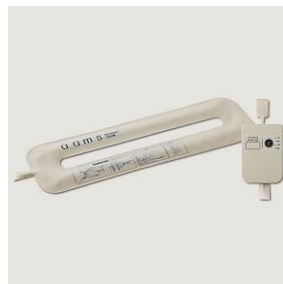
見守り・コミュニケーション