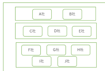
ブレイクアウトルームを使用した場合