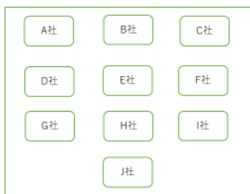
通常のZoomミーティング