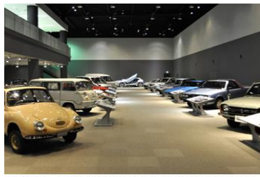
世界ラリー選手権の競技車両や歴代のSUBARU車を 展示するコーナーです。