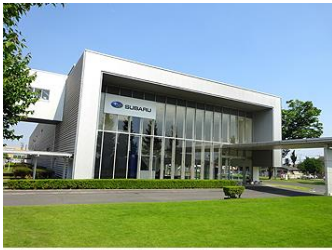
群馬県太田市の矢島工場正門より入ってすぐ。 右手にはジェット練習機初雁もお出迎えています。