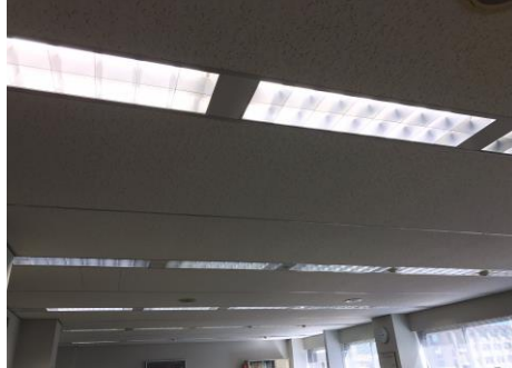
①取得財産工事箇所が写ったカラー画像