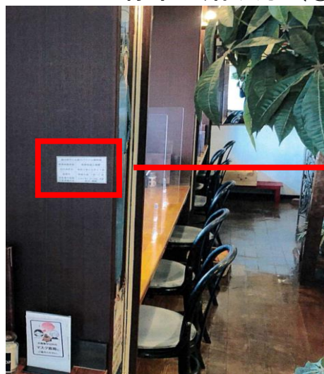
①取得財産全体が写ったカラー画像 ※工事の場合、施工箇所の入口などに貼付