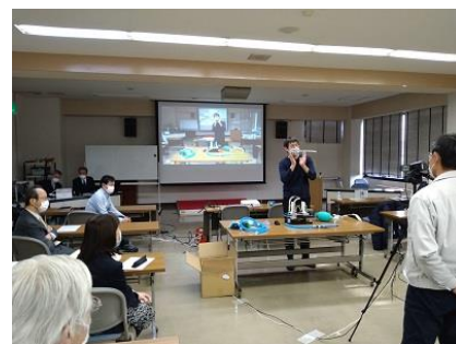
メディカルデザインセミナー 実演風景