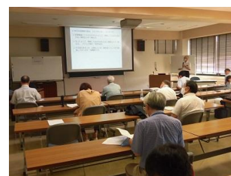
第 1 回セミナー 講義風景