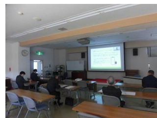
第 3 回セミナー 共同視聴会