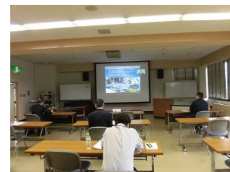
第 2 回セミナー 共同視聴会