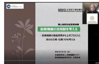
第 4 回セミナー 配信画面