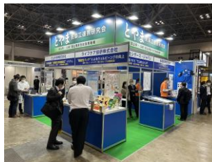
富山県共同ブース出展風景