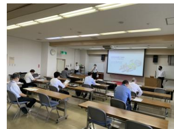
第3回セミナー 講義風景