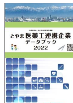
とやま医薬工連携企業データブック 2022