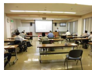
マッチングイベント会場風景

AMED 事業「医工連携イノベーション推進事業 地域連携拠点自立化推進事業」で公益財団法人名古屋産業技術研究所が代表を務める「中部圏において持続的に次世代医療機器産業を創出するための産・学・支援機関の広域連携ハブ拠点の形成と運用」に再委託機関として参画した。