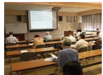
第 1 回セミナー 講義風景