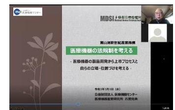
第 4 回セミナー 配信画面