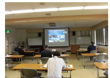
第 2 回セミナー 共同視聴会