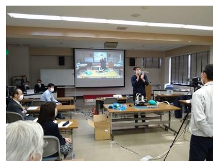
メディカルデザインセミナー 実演風景