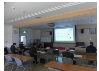
第 3 回セミナー 共同視聴会