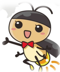
小矢部工場マスコットキャラクター「おやっぴ」