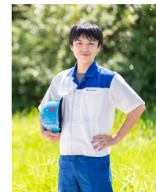
技術部 生産技術課 係長 工学部機械工学科卒

そしてインターンシップに参加しようとしている皆さん！最初から絞り込みすぎず、“今の”自分が「やってみたい」「面白そう」と思う会社を足を運んでみてください。様々な会社を見た中で、その道の先にスズキ部品富山があれば幸いです。インターンシップで会いましょう！